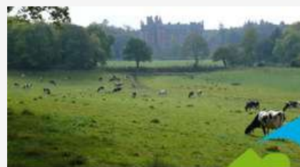
La vie de la station de Trévarez